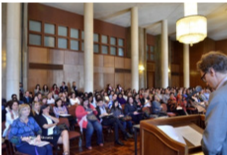
el Salón de Ceremonias de la Intendencia de Montevideo en el marco de la 36ª Feria Internacional del Libro.