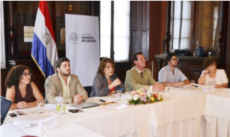
Arq. Mabel Casaurano, Ministra de Cultura (centro)

El Congreso se enmarca dentro del festejo del Día del Bibliotecario Paraguayo, y el 40° aniversario de la ABIGRAP y de la Sección para América Latina y El Caribe de laFLA.