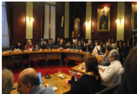
El CDC sesionando, previo a la creación de la FIC. Como invitados, los miembros del COMDIC, actuales autoridades de la FIC.

El 1° de octubre de 2013 el Consejo Directivo Central (CDC) de la Universidad de