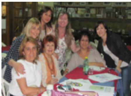
Asociación de Bibliotecarios del Chubut Argentina

Se ha participado en reuniones de ABGRA, se forma parte de la Red Nacional de Asociaciones de Bibliotecarios (RENABI), en la Feria del Libro del 2013 la vicepresidenta estuvo como panelista en mesa de trabajo sobre Asociaciones de Profesionales, estamos presentes en las Jornadas de Bibliotecarios organizadas en Trelew.