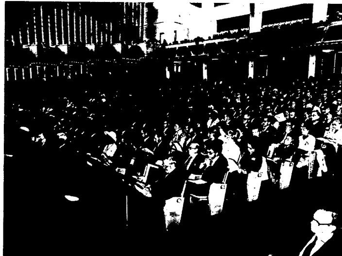
Ceremonia de apertura de la 45o. Conferencia General, con la presencia de la reina Margaret de Dinamarca.