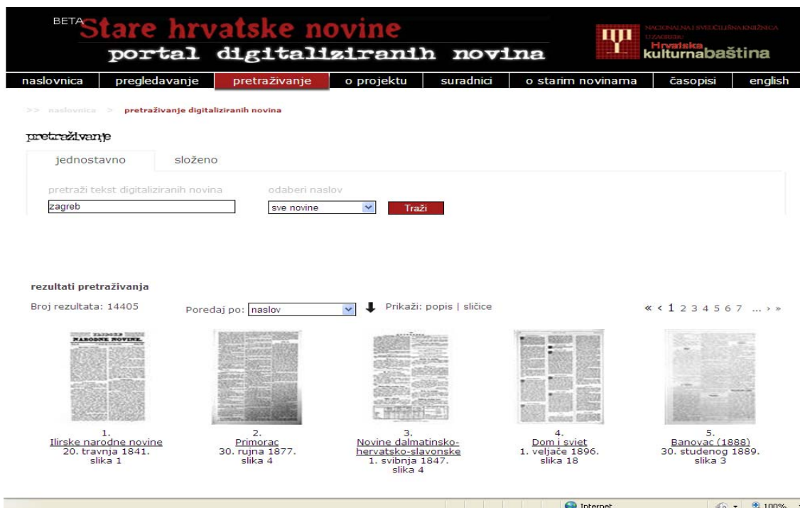
圖表5：入口的搜尋頁面

雖然報紙和期刊皆屬於同一類型的出版物——報刊，但兩者明確的特色其實有所區別，影響入口不同部分的功能差異。對克羅埃西亞歷年報紙有資訊需求的用戶可以藉由以下方式取得：歷年報紙全文搜尋、瀏覽依字母排列的標題及其後設資料、個別標題搜尋或進階搜尋（見圖表 5）。此外，用戶可透過日曆檢視刊物，選取克羅埃西亞地圖的郡以瀏覽標題。他們可以看到哪些報紙在 19 世紀的哪個郡市出版，及哪些標題已經數位化。給克羅埃西亞歷年期刊用戶的其他功能有瀏覽每個議題的內容，搜尋並下載 pdf 格式的期刊文章。