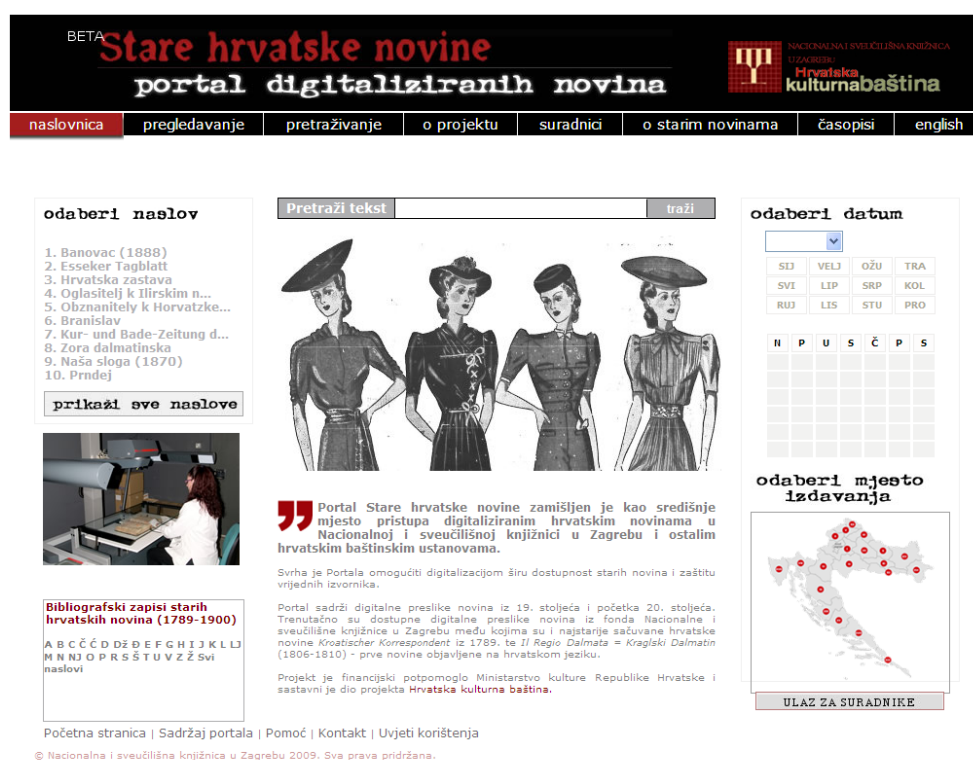
圖表 1：克羅埃西亞歷年報紙之入口

為了保護查格雷布之國家圖書館（此文以下皆簡稱「圖書館」）內克羅埃西亞最早期、寶貴的原始報刊之館藏，並開放給用戶使用，此圖書館開始於 2001 年將這些資料進行數位化，以達成其「收藏、編輯目錄、儲存、保護及確保大眾能使用其館藏」之使命；此館擁有自 19 2 世紀該國出版的報紙以來最完整齊全的有編排目錄之館藏 3 。克羅埃西亞其他圖書館和文物機構也開始著手將其館藏數位化，但這些個別的數位化專案之成果並非總能讓大眾取得或搜尋。此外，克羅埃西亞的期刊並沒有一致的目錄格式，使其能包含最基本的館藏後設資料和資訊，或其完整性和狀況，因而能成為選取標題進行數位化的基礎，及報刊數位化的整體協調。