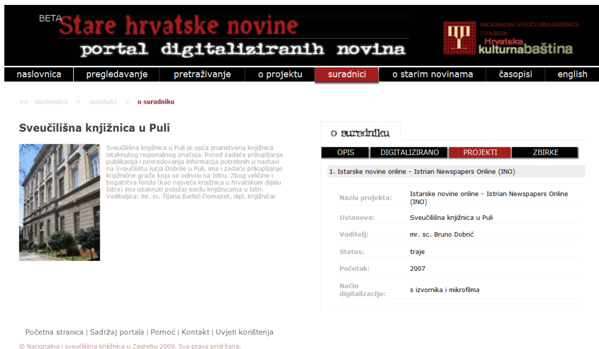
圖表 3：有關參與機構的基本資訊

參與的機構（見圖表 3）擁有類比或數位報紙期刊館藏的機構，可以透過合作模組直接將後設資料輸入該系統。此模組的使用授權依每個機構擁有的不同權限程度而調整。入口功能如同內容儲存庫，因為它也可儲存參與機構傳送的數位影像。